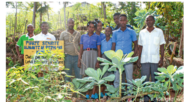
Hilfe in Haiti

Spenden werden benötigt, um anfallende Betriebskosten lokaler Tafeln zu decken. Dazu gehören z. B. Mieten für Lagerräume, Energiekosten für Kühllhäuser sowie Reparatur- und Benzinkosten von Fahrzeugen. Die lokalen Tafeln können darüber hinaus auch Spenden dafür einsetzen, um gezielt Kinder und Senior:innen unter den Tafel-Kund:innen zu unterstützen.