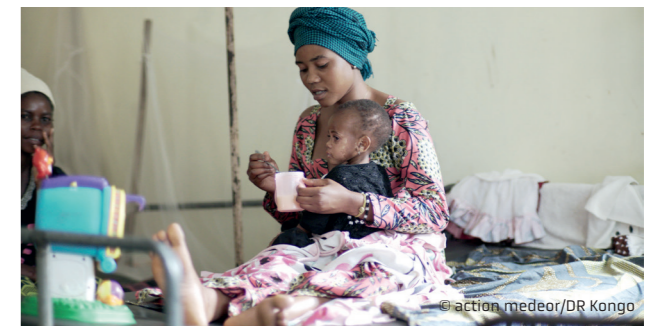
Hilfe in Afrika