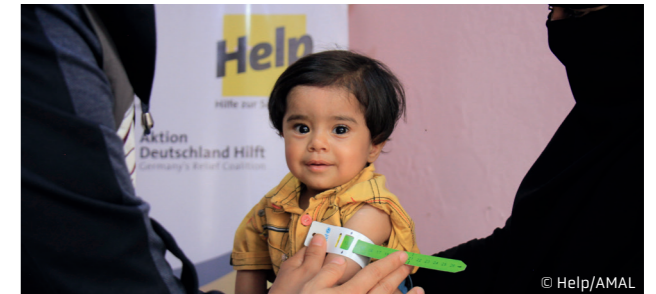
Hilfe in Syrien