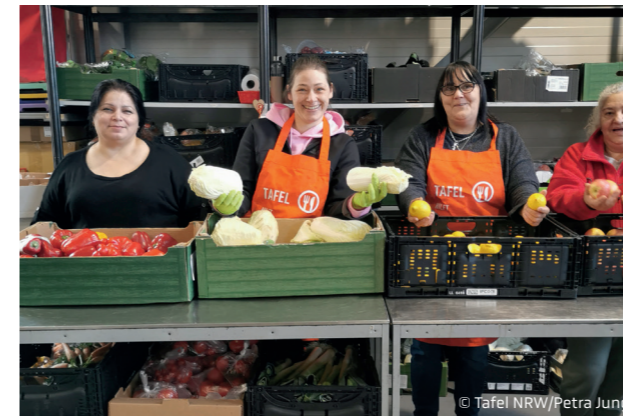
Tafeln in NRW helfen

Die komplette Liste der Hilfsprojekte kann auf unserer Website eingesehen werden – nutzen Sie gerne den QR Code!