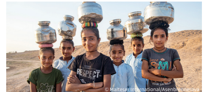
Hilfe in Indien